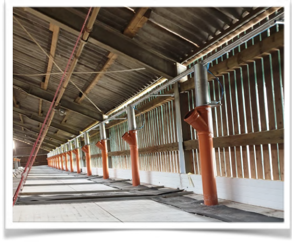
Abwurfbehälter für Nesteinstreu