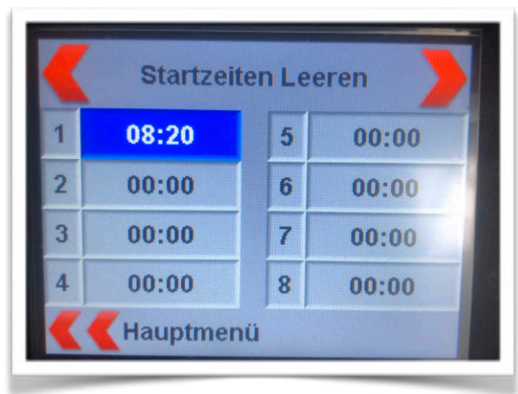
einfache Steuerung per Touch